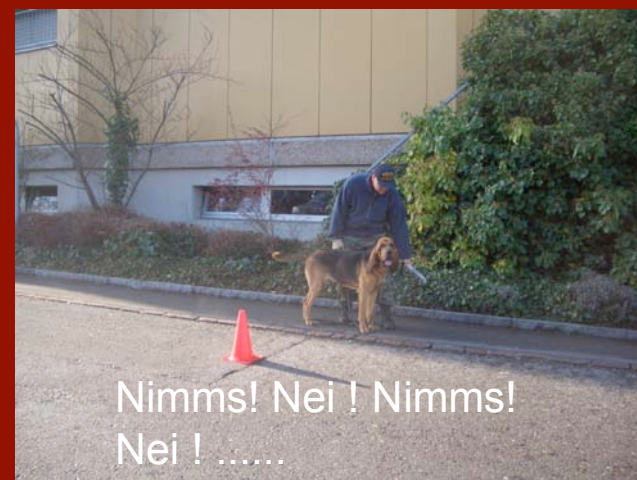
Nimms! Nei ! Nimms! Nei ! .....