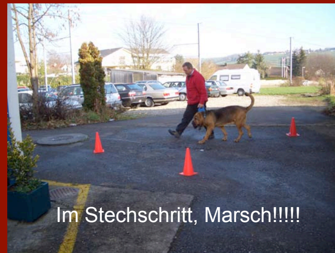
Im Stechsritt, Marsch!!!!